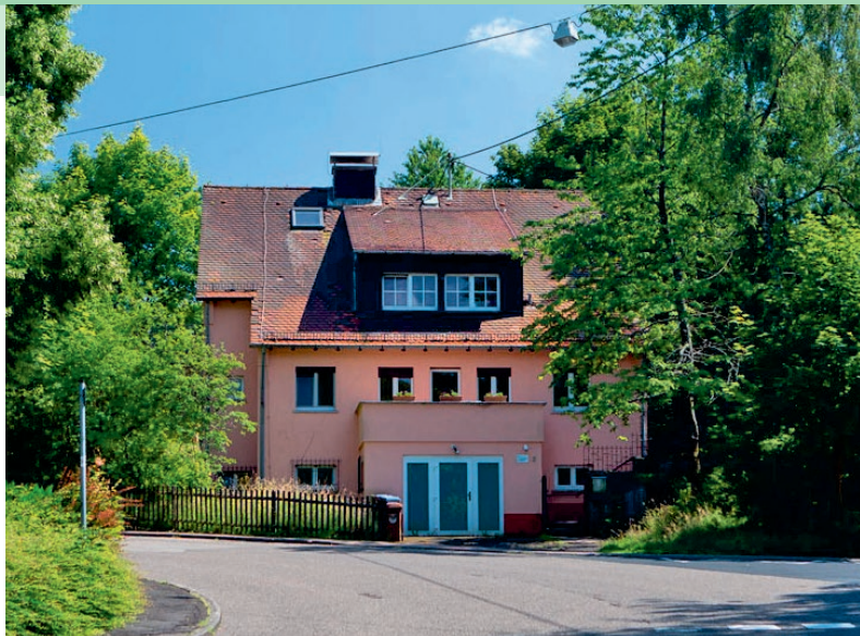
Einrichtung Haus Bleistein